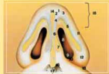
▲ آناتومی نواحی مختلف بینی

سپس در پایان با بستن محل برشها بدون اینکه نیاز به بریدن و یا بخیه بر روی پوست بینی باشد عمل خاتمه می یابد. در طی عمل جراحی بینی بنا بر نیاز ممکن است «قوز» یا برجستگی بینی که شامل غضروف های جانبی و پشت بینی و استخوان بینی است برداشته شود. سپس با جمع کردن دو طرف استخوان ها، بینی بیمار از طرفین جمع و کوچکتر می شود.